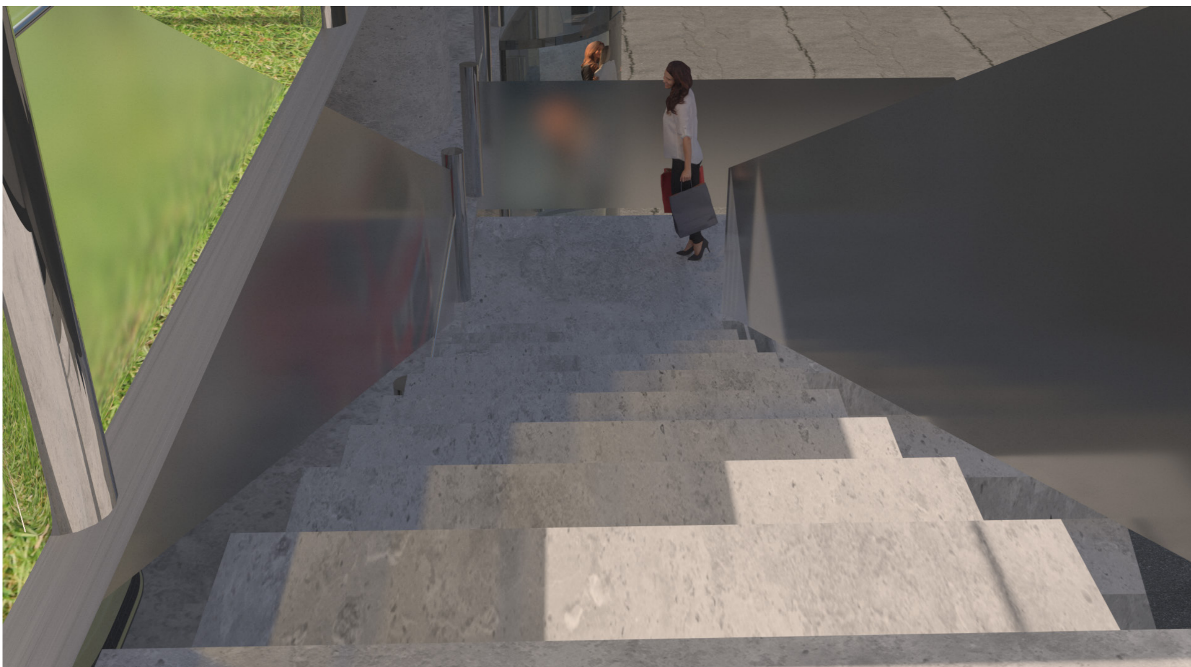
PARKHAUS BERLINER RING